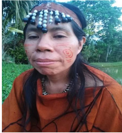
Representación pictórica del rostro: cola de mono y el amor a los animales