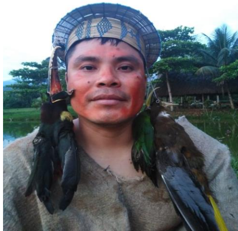
Representación pictórica del rostro: guerrero, simboliza la sangre derramada del adversario y la preparación para el enfrentamiento con otros grupos étnicos. Actualmente, simboliza desacuerdo ante propuestas y negociaciones de intereses con la población colona o en reuniones importantes de la comunidad. Las aves y la corona simbolizan la conexión con la flora, fauna y la naturaleza de su entorno geográfico.